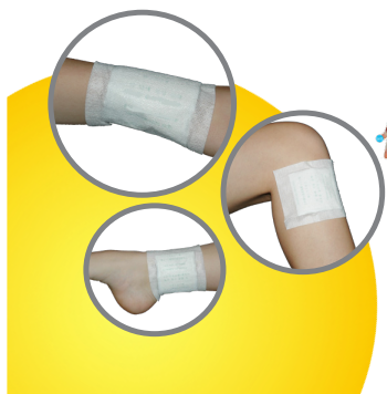
nach dem Gebrauch